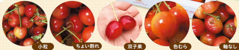
小粒 ちよい割れ 双子果 色むら 軸なし

※写真はイメージです。お客様への連絡なしにパッケージが変更になる場合がございます。 ※詰め方が「1kg」→「500g×2」に変更になる場合がございます。ご了承ください。 ※こちらの商品は「贈答用」は承りません。